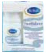
Intensiv-Nachtpflegekur mit Söckchen